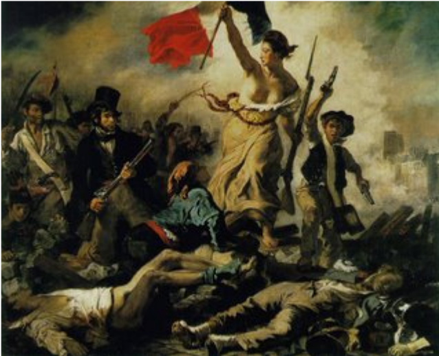
A Liberdade Guiando o Povo, quadro de Eugéne Delacroix que representa a Revolução Francesa.