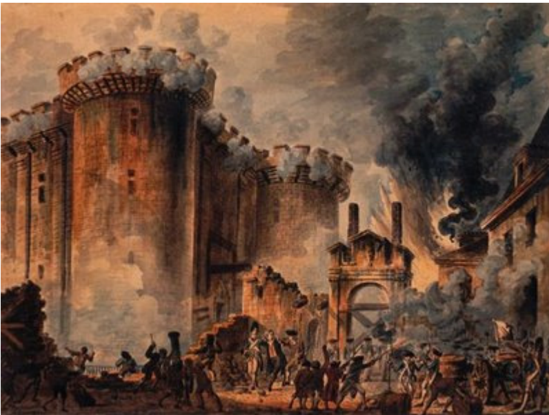
Quadro de Jean-Pierre Houël que retrata a queda da Bastilha.