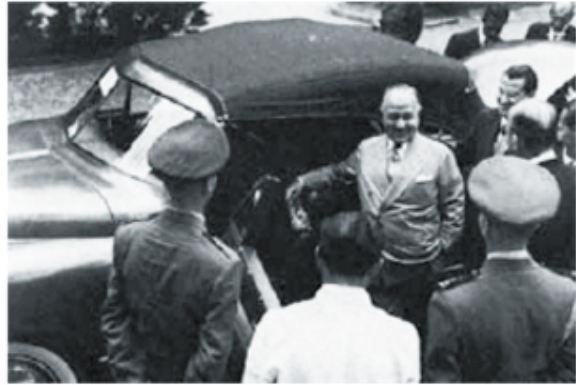
Getúlio Vargas examinando o protótipo de um carro brasileiro produzido pela Fábrica Nacional de Motores, em 1951.