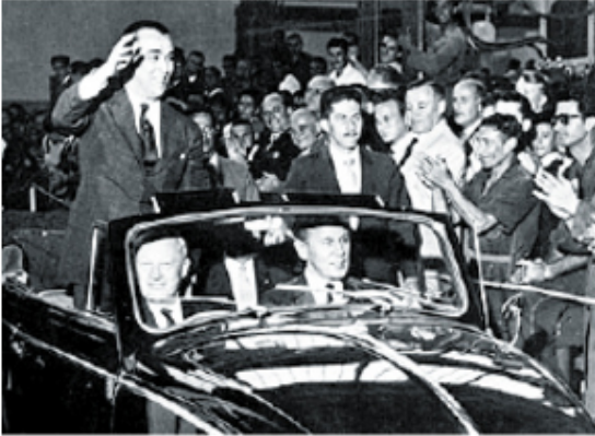
Juscelino Kubitschek na inauguração da representação da Volkswagen no Brasil, em 1959.