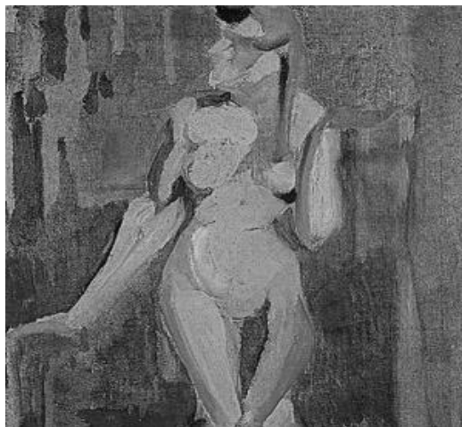
"Nu Cubista nº 1" (Anita Malfatti, 1915)

Anita foi um elemento catalisador para o Modernismo no Brasil. "Foi ela, foram os seus quadros, que nos deram uma primeira consciência de revolta e de coletividade em luta pela modernização das artes brasileiras", disse o escritor Mário de Andrade.