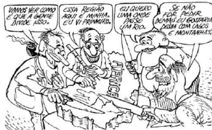
NOVAES, Carlos Eduardo; RODRIGUES, Vilmar. Capitalismo para principiantes: a história dos privilégios econômicos . 27. ed. São Paulo: Ática, 2003. p. 88.

O Imperialismo consiste entre outros fatores na busca por mercados produtores de matéria-prima e mercados consumidores dos produtos industrializados, além da disputa por áreas de influência e possíveis colônias no globo terrestre, principalmente na África, Ásia, Oceania e América Latina.